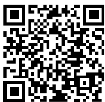
Neueste Version zum Herunterladen

DuPont Packaging Graphics beweist erneut seine globale Position als führender Lieferant innovativer Lösungen für den Flexodruck. Auf der Basis neuester Technologien hat unsere Forschung verbesserte Lösungen in der Druckformherstellung entwickelt, die es unseren Kunden ermöglichen in neue profitable Flexo-Marktsegmente vorzustoßen. Das Produkt Portfolio umfasst Cyrel® Fotopolymerplatten ( analog und digital ), Cyrel® Geräte zur Plattenherstellung, Cyrel® round Sleeves , Cyrel® Montagesysteme sowie das revolutionäre thermische Cyrel® FAST System .